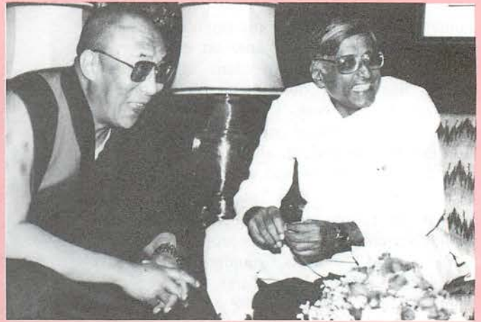
Le Dalaï-lama et le sénateur et écrivain Rajmohan Gandhi à la Nouvelle Delhi lors de la journée de réflexion sur la paix et la justice

Intense activité, depuis le début de l'année, au centre du Réarmement moral en Inde et dans le reste du pays: du 4 au 14 janvier, une session portant sur la réconciliation réunit 160 par-