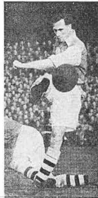
JOE MERCER: "There is no middle way. It has got to be one thing or the other—Moral Re-Armament or Communism."

The New York Times wrote, "Hollywood could well copy the smooth deputation and superb colour photography. This picture is beautiful to watch. Miss Sugar is doing 'magnificent'."