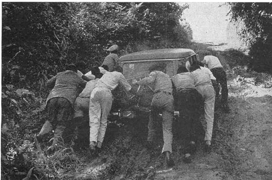
Trois semaines de déplacements sur des pistes détrempées.

Lorsqu'un ancien dirigeant mau-mau et un colon du Kenya eurent montré qu'il s'agissait là de leur propre expérience et qu'ils luttèrent ensemble pour une Afrique libérée de la haine et de la peur, un long silence s'établit, que rompit finalement le préfet de Kaniama par ces mots : « Vous êtes venus au bon moment, alors que nous avons le plus besoin d'être réarmés moralement. » La rencontre se termina sur ces paroles du commissaire de district : « Kaniama a trouvé aujourd'hui la solution. La cuisine de Kaniama est maintenant nettoyée. C'était d'ailleurs dans cette intention que j'avais demandé à la délégation du Réarmement moral de m'accompagner ici. »