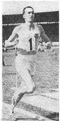
HERB ELLIOTT: "The voice of 'The Crowning Experience' is the spirit Britain needs to reach the challenge of our time."